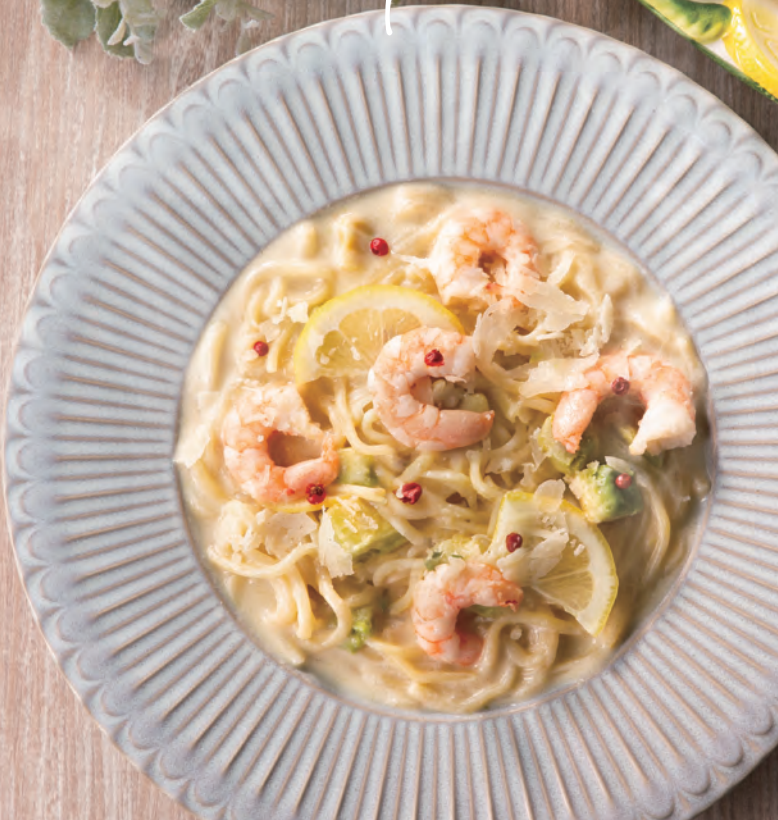
海老とアボカドのレモンクリームソース + ¥330 (税込)

人気のレモンクリームソース! さわやかなレモンの風味とクリーミーなソースが 絶妙なバランスです。