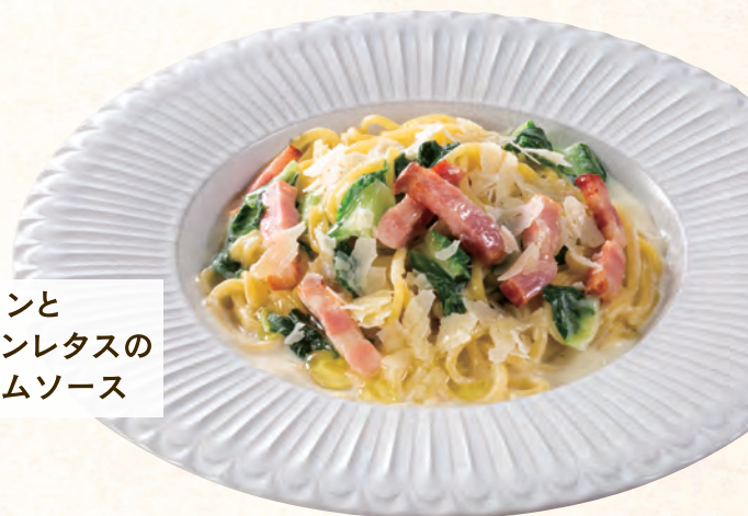
ベーコンと ロメインレタスの クリームソース