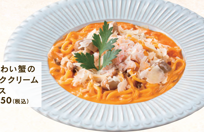
紅ずわい蟹の ビスククリーム ソース + ¥550 (税込)

人気のレモンクリームソース! さわやかなレモンの風味とクリーミーなソースが 絶妙なバランスです。