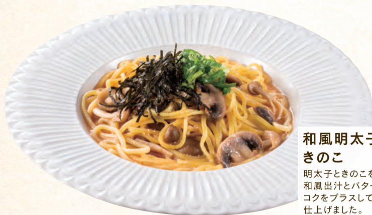
和風明太子と きのこ