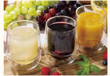
フルーツジュース