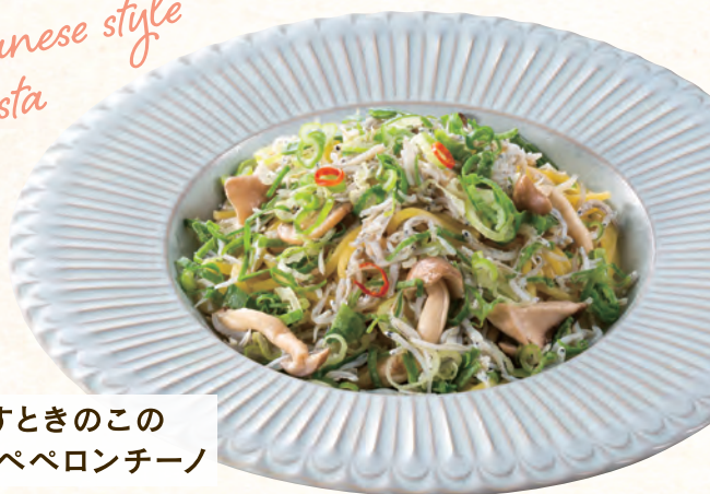
しらすときのこの 和風ペペロンチーノ