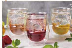
フレーバーソーダ