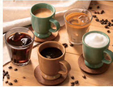
エスプレッソアレンジラテ