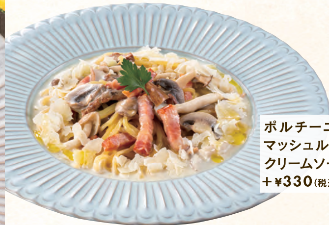
ポルチーニ茸と マッシュルームの クリームソース + ¥330 (税込)